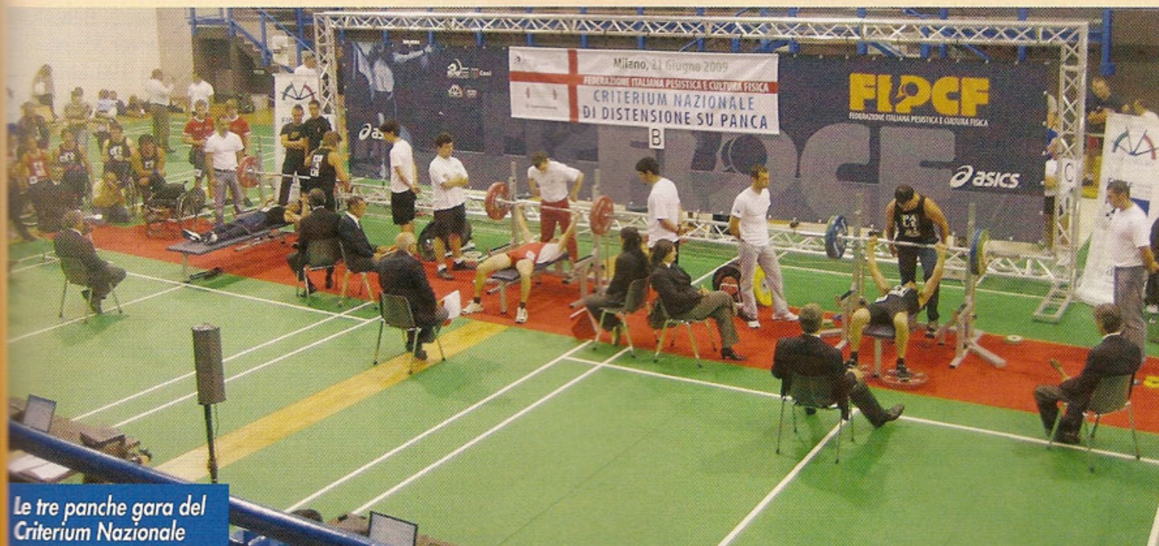
Le tre panche gara del Criterium Nazionale