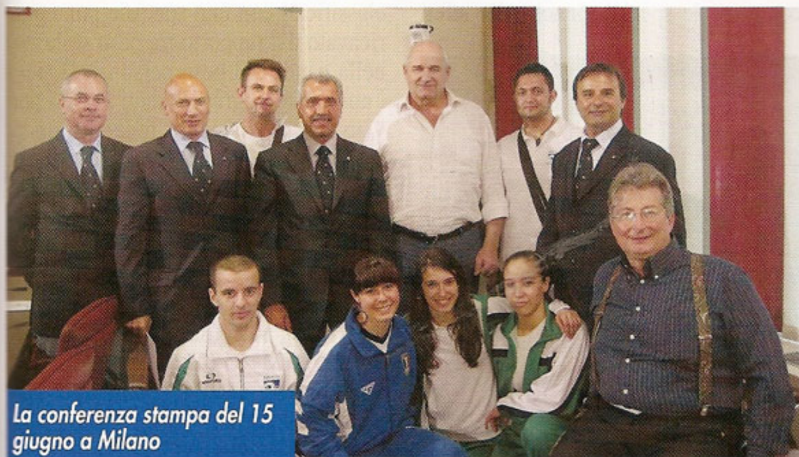
La conferenza stampa del 15 giugno a Milano