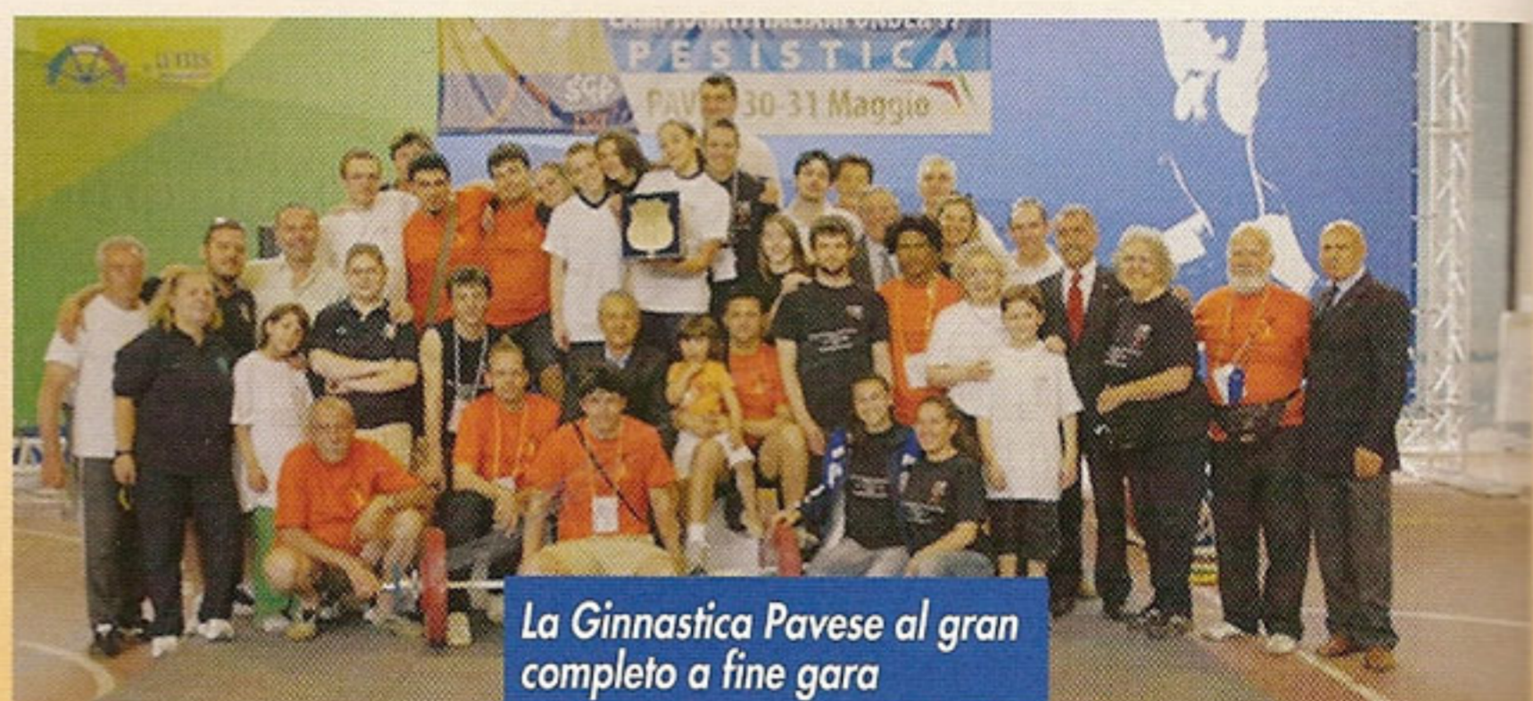
La Ginnastica Pavese al gran completo a fine gara