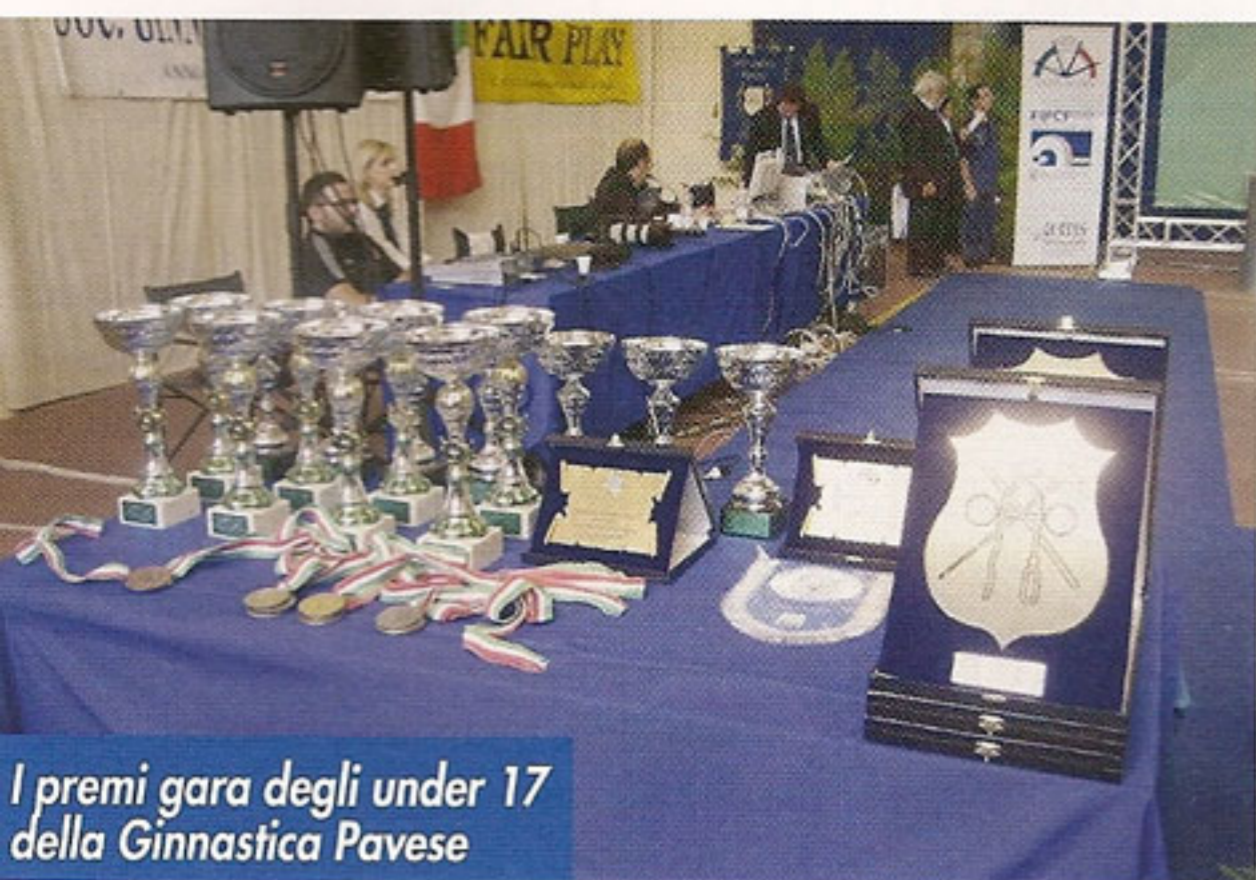
I premi gara degli under 17 della Ginnastica Pavese