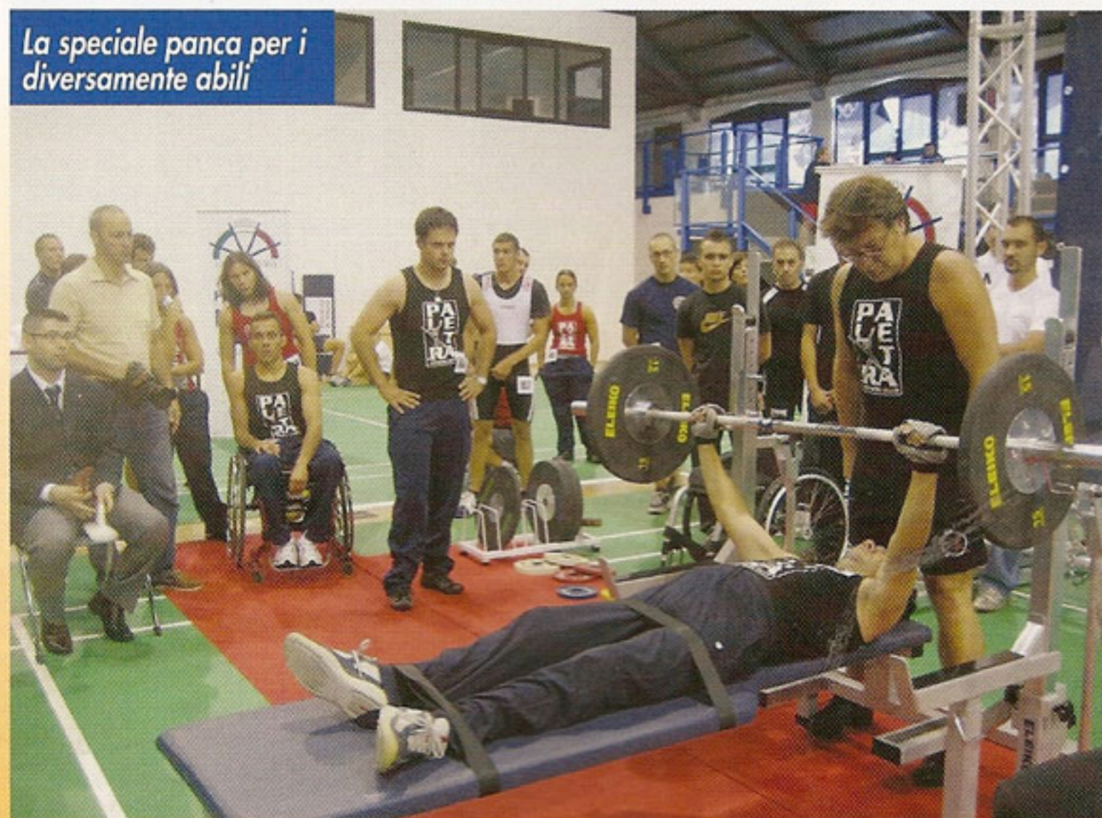
La speciale panca per i diversamente abili

prese con una personale e ben riuscita esibizione della distensione su panca e con la promessa di partecipare il prossimo anno in una problematica veste di atleta.