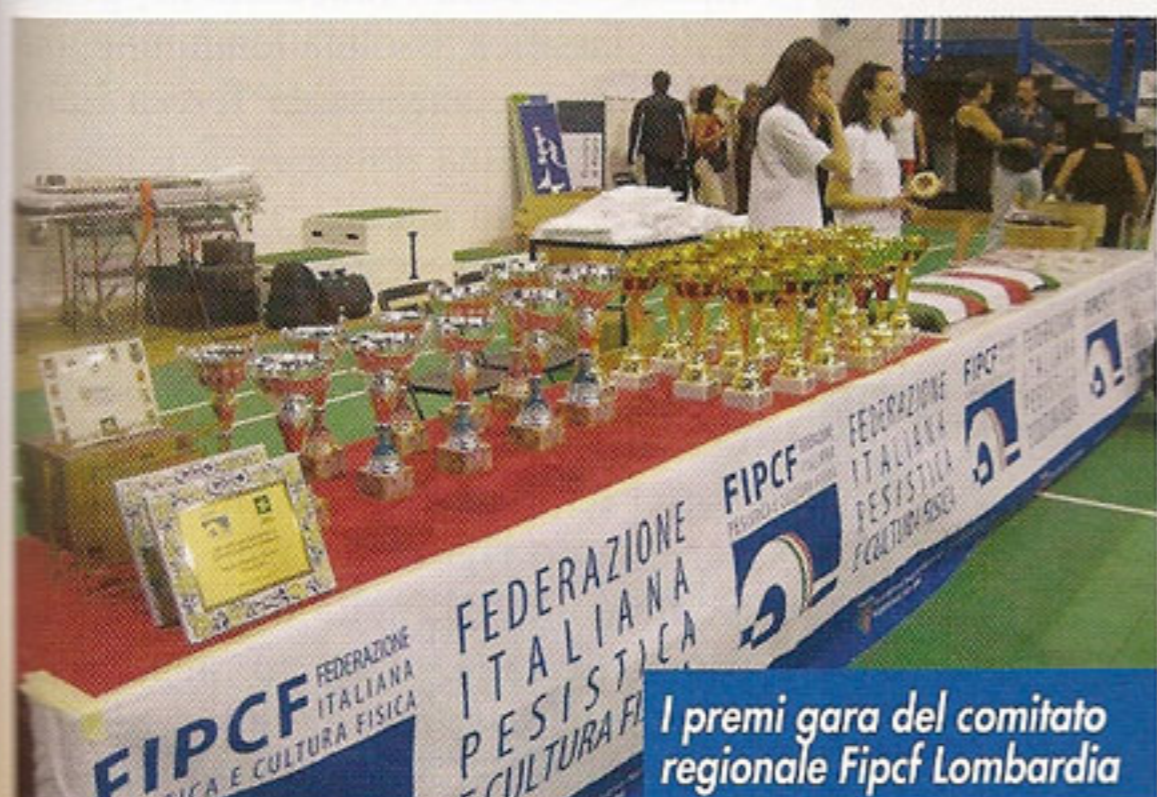
I premi gara del comitato regionale Fipcf Lombardia